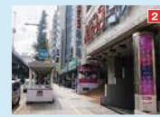
2 出口を出てそのまま直進。100mほど進むと、2 出口に合流します。