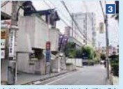
3 右折して50mほど進むと左手に「出雲大社東京分祠」が見えてきます。