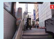
1 出口を出てそのまま直進。「みずほ銀行」前を通過します。