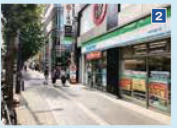
2 さらに直進して「ファミリーマート」と「ローソン」の間の路地へ右折。