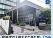
4 「出雲大社」のすぐとなりが、「ベルサール六本木」(住友不動産六本木通ビル)です。